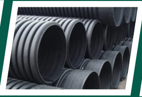
Under ground electric lines