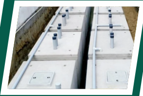
Sewage treatment plant