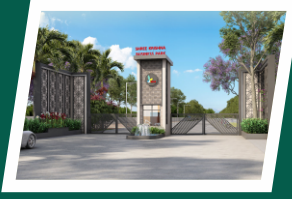
Modern gate with security cabins