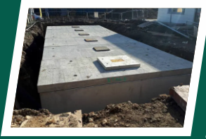
Underground water reservoir