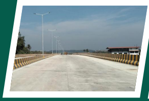
Load bearing concrete Roads (60 & 40) Ft.