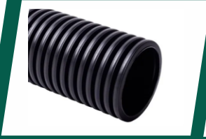
Below-ground sanitation system