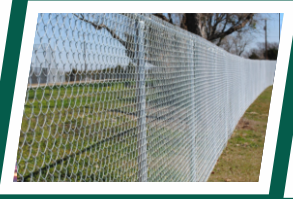
Chain link fencing